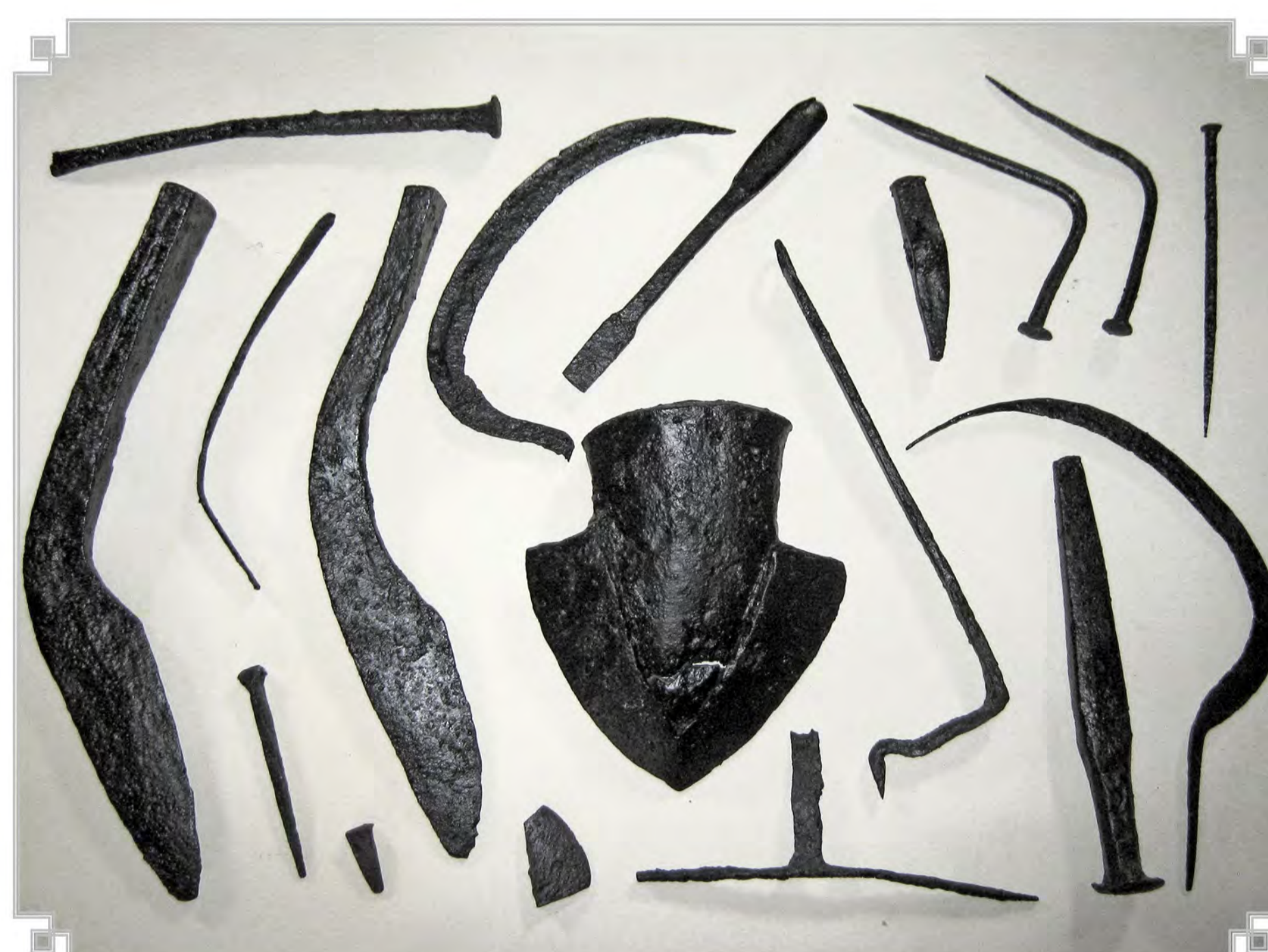
ZAKLADNA NAJDBA « ORODJA, MLAJŠA ŽELEZNA DOBA.