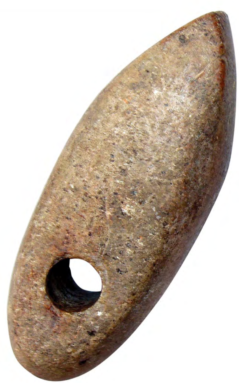
KAMNITA SEKIRA, MLAJŠA KAMENA DOBA.