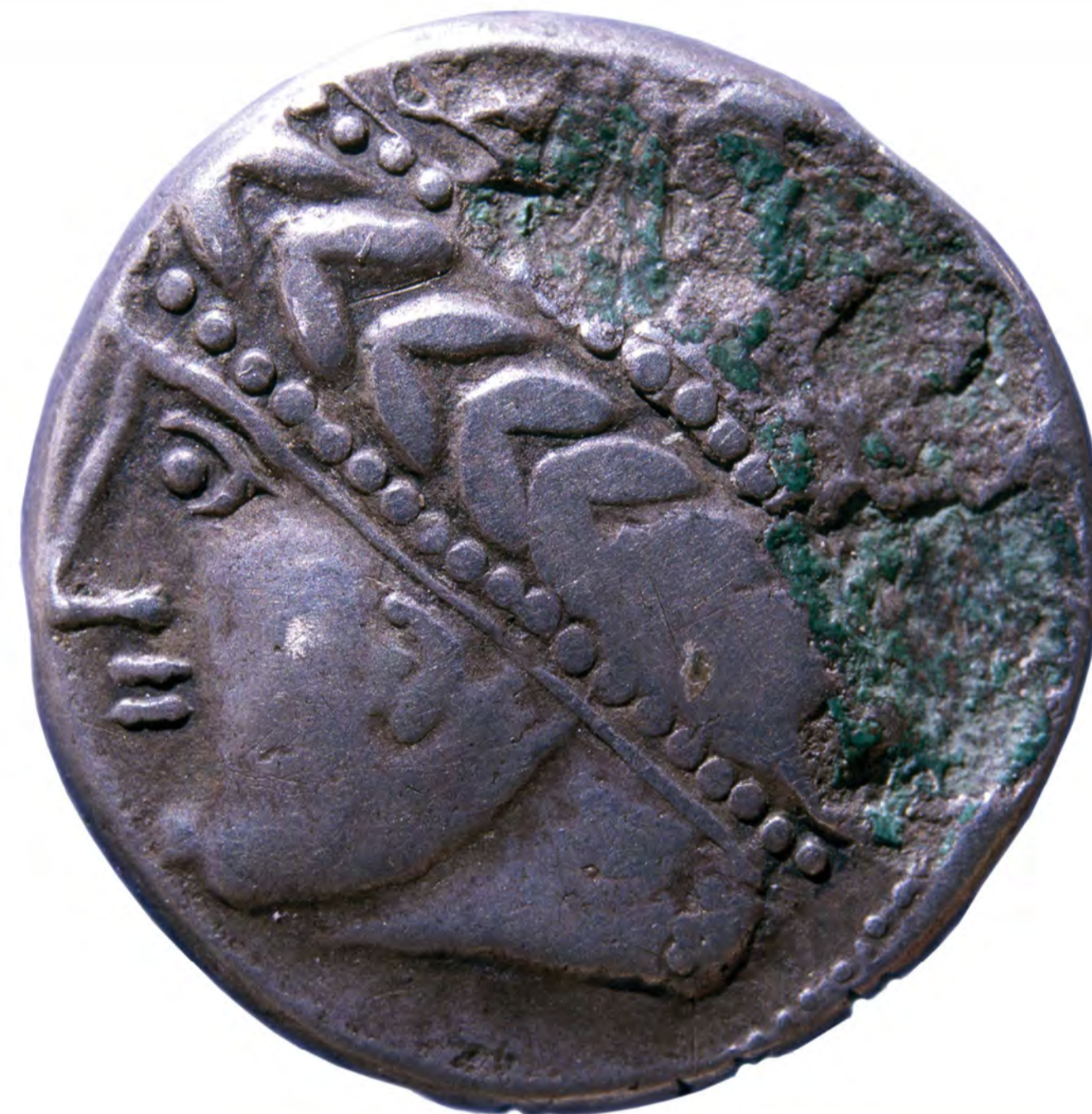
AVERZ KELTSKEGA KOVANCA, I. STOL. PR. N. ŠT.