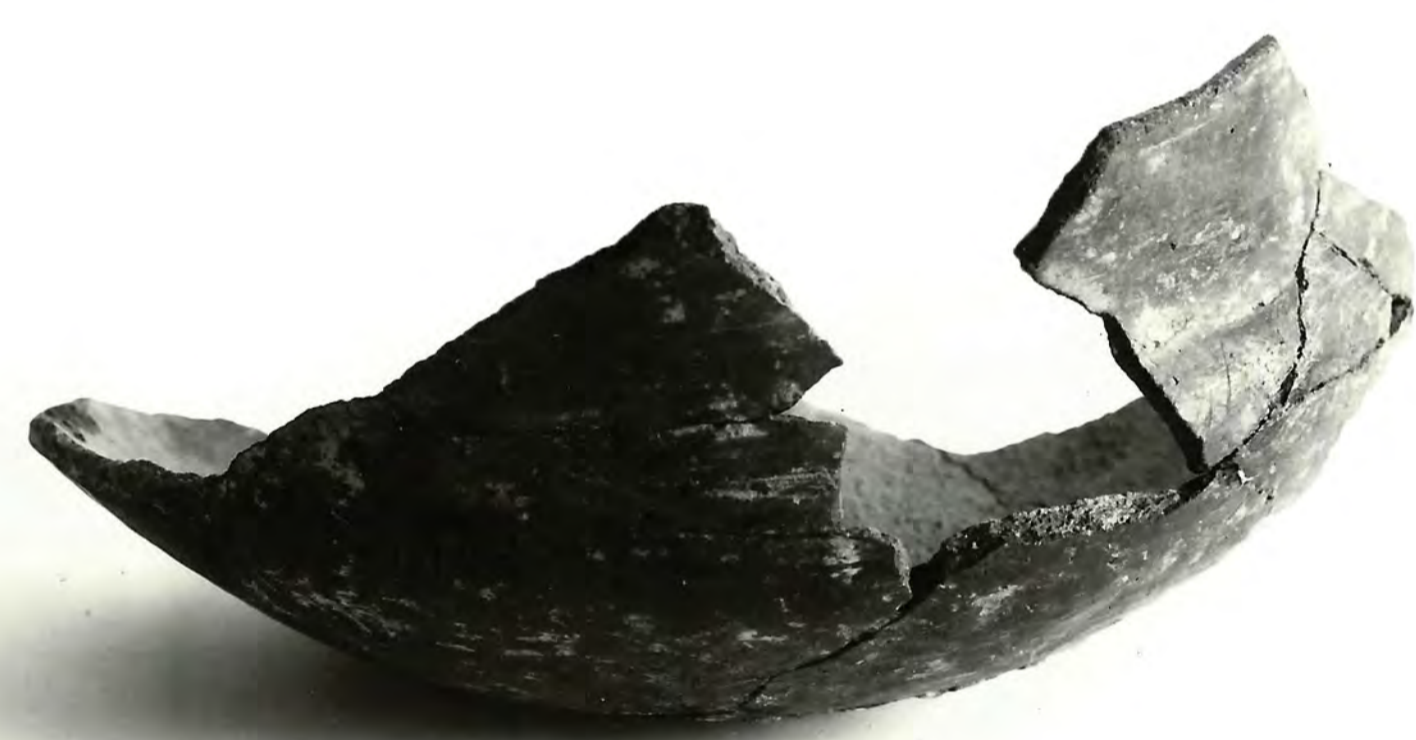
DEL POSODE IZ ŽARNEGA GROBIŠČA, RASTENEGG, BAKRENA/ŽELEZNA DOBA.