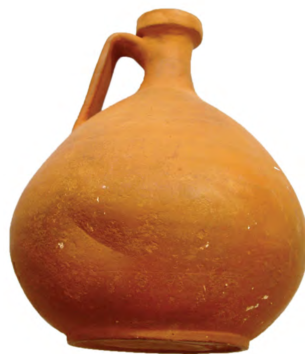
VRČ IZ ŽGANE GLINE, 2. STOL.