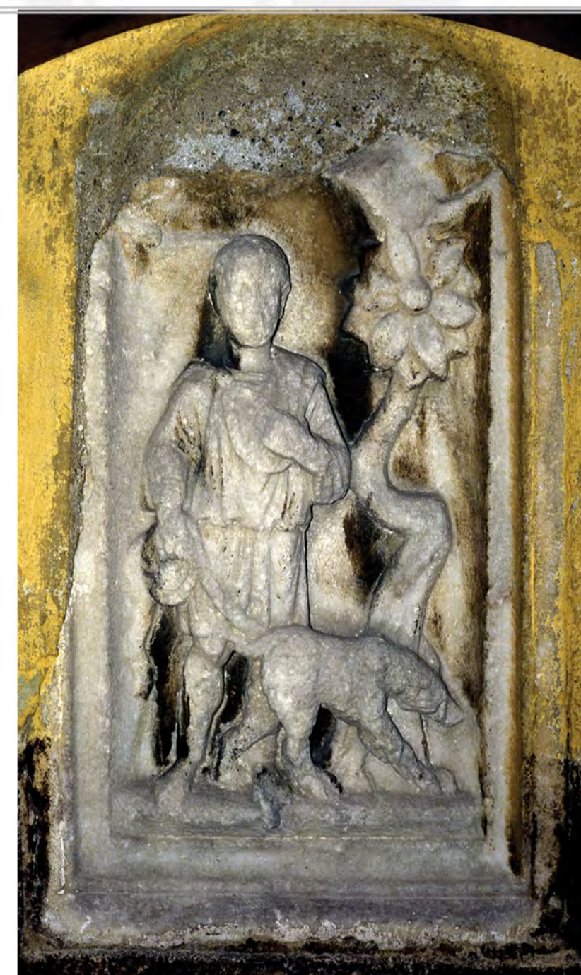
DEL RIMSKEGA NAGROBNEGA SPOMENIKA Z LOVSKIM PRIZOROM, 3. STOL.