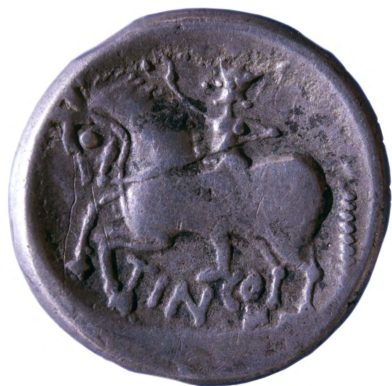
REVERZ KELTSKEGA KOVANCA, I. STOL. PR. N. ŠT.