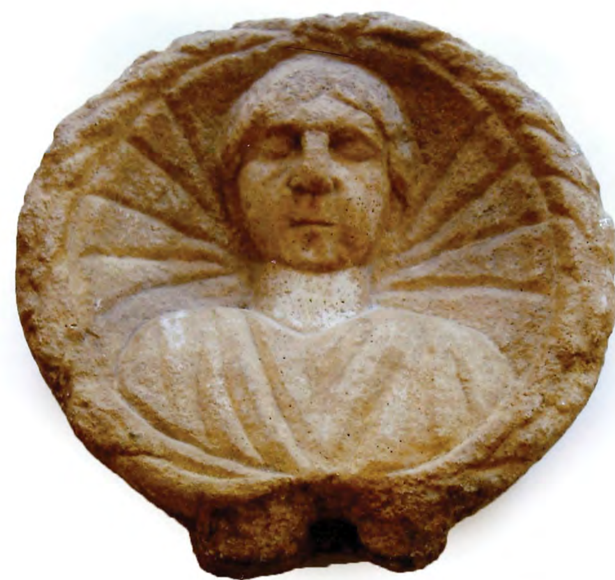
DEL RIMSKEGA NAGROBNEGA SPOMENIKA, KONEC 2. STOL.