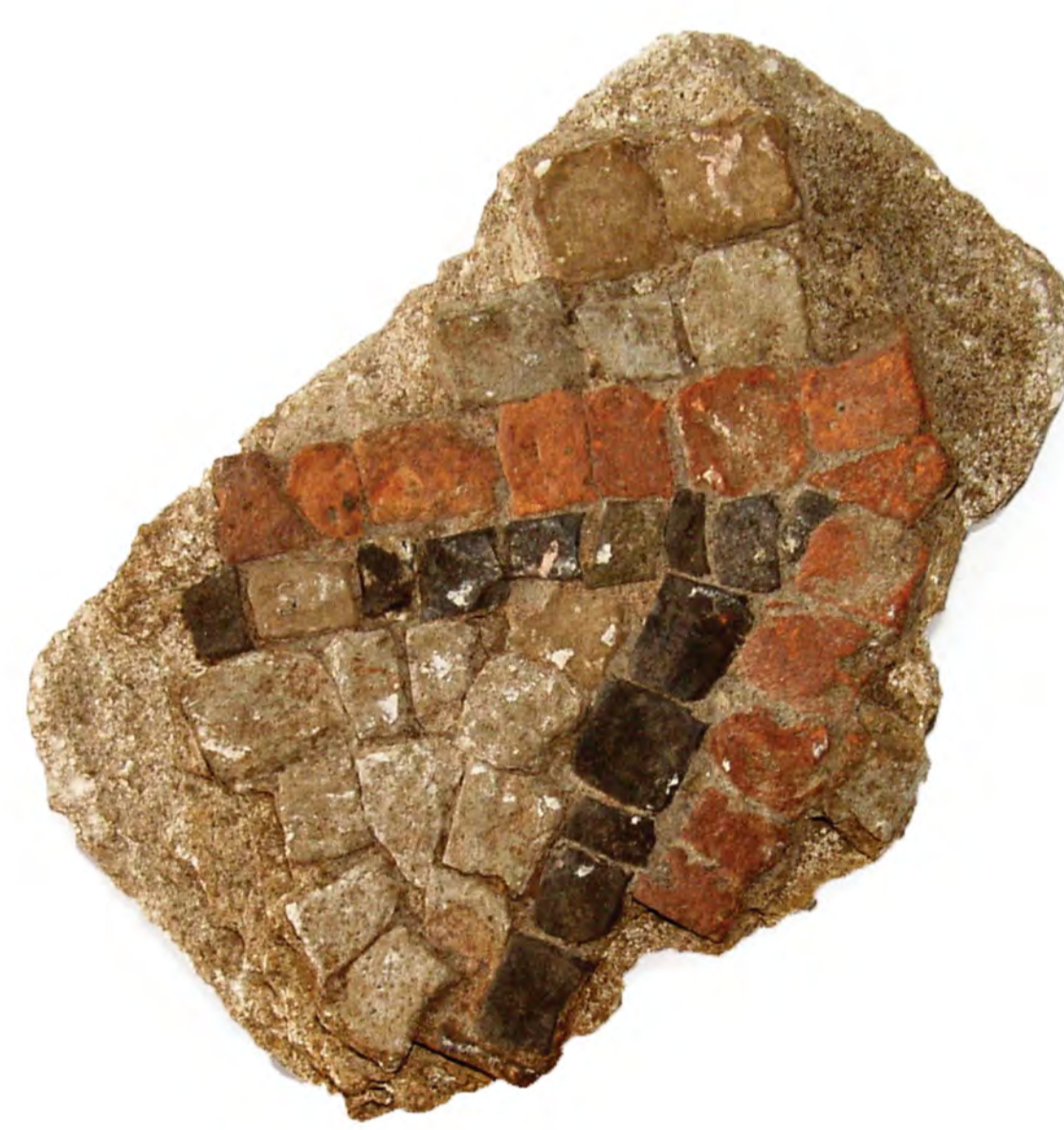
DEL MOZAIKA, 2. STOL.