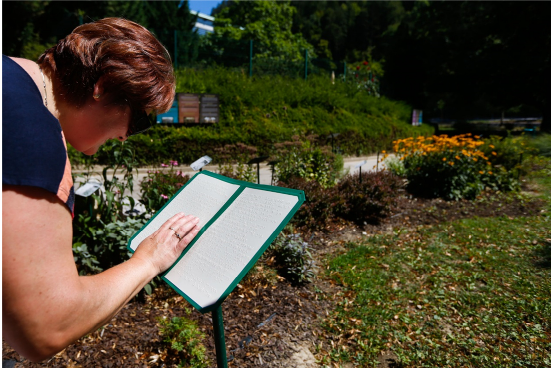
Tabla z brajico na vrtu medovitih rastlin v zdraviliškem parku

Podjetje MM Tours nudi prevoz s prilagojenim avtobusom za invalide.