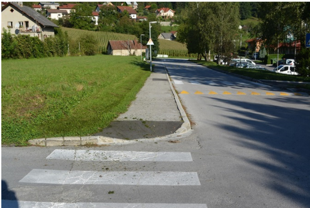
Znižan cestni robnik na prehodu pri zdravstveni postaji Rimske Toplice