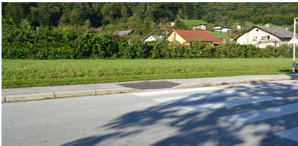
Znižan cestni robnik na prehodu pri OŠ Rimske Toplice

Prilagajanje cestnih robnikov. V skladu s akcijskim načrtom, občina Laško prilagaja in znižuje cestne robnike pri prehodih čez cesto. Trenutno je prilagojenih že 80% vseh prehodov. V letu 2015 so se uredile tudi poti v zdraviliškem parku Thermane Laško