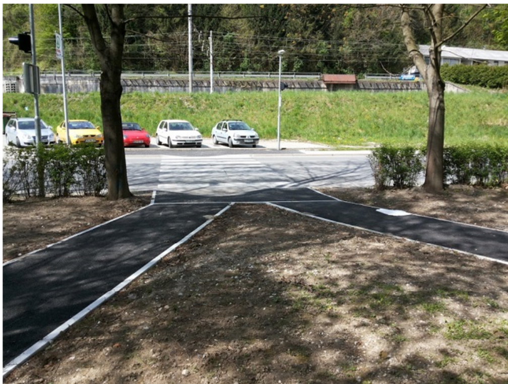
Novo urejena pot v zdraviliškem parku in prehod čez glavno cesto

Igrala za otroke s posebnimi potrebami: Postavitev igral za otroke s posebnimi potrebami. Pridobljeno je soglasje za postavitev igral v zdraviliškem parku Thermane Laško. Občina bo iz proračuna Občine Laško zagotovila dodatnih 5.000 € za postavitev igral.