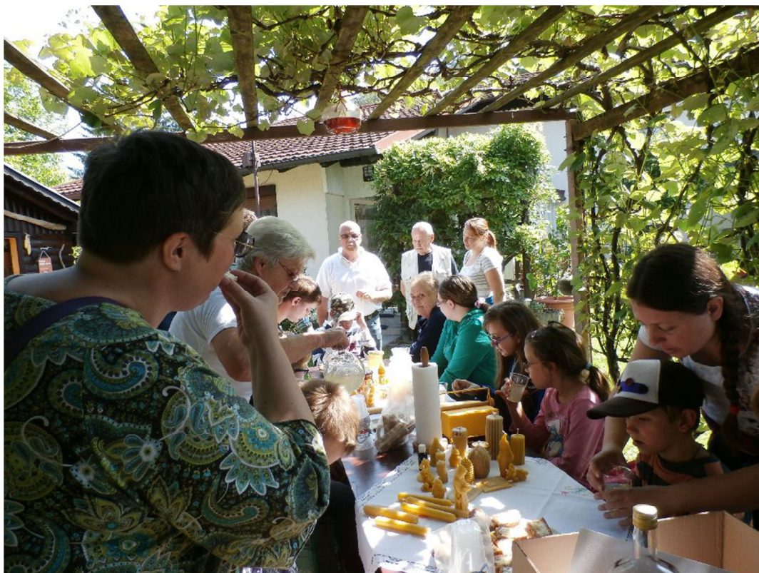
Foto: STIK Laško – obisk šole za slepo in slabovidno mladino pri čebelarju