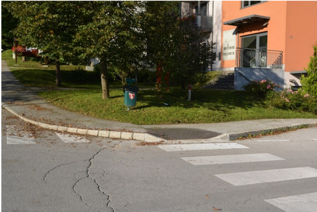
Znižan cestni robnik na prehodu pri zdravstveni postaji Rimske Toplice

Pločnik pri zdravstveni postaji Rimske Toplice : Občina Laško je v sodelovanju s Komunala Laško pričela s aktivnostmi za prilagoditev cestnih robnikov za potrebe invalidov v Rimskih Toplicah. V skladu z akcijskim načrtom so bili v letu 2015 znižani robniki na treh mestih pri zdravstveni postaji Rimske Toplice.