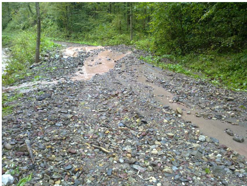
Slika 1: Neprevozna cesta

Poplavljeni vodotoki, naplavine in sproženi plazovi so povzročili neprevoznost regionalnih/državnih in občinskih cest (prometno nedostopno je bilo območje Jurkloštra, Tevč, itd.).