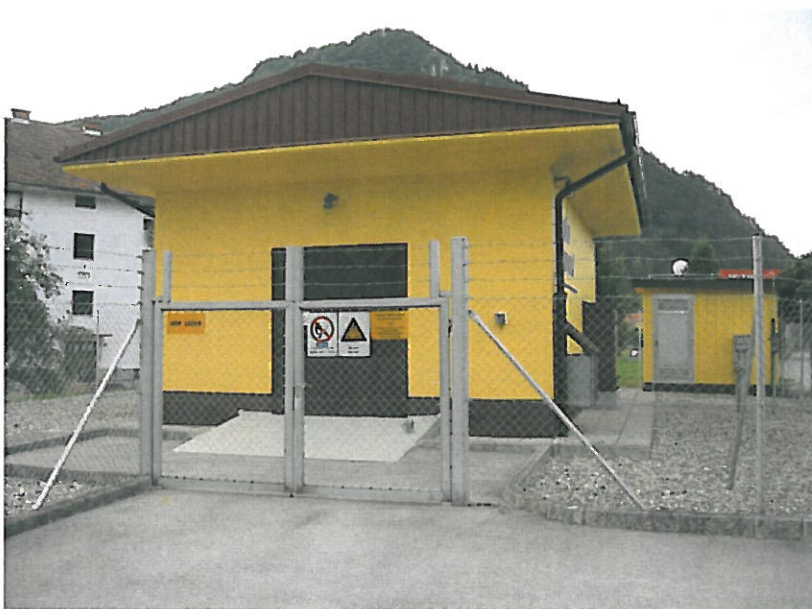
SLIKA 1: MRP Laško

V decembru 2013 je bil opravljen tudi redni letni servis odorirnih naprav v MRP Laško in MRP Pivovarna. Delo je opravilo podjetje IMP Promont Montaža d.o.o., Ljubljana. Strošek servisa je znašal 974,70 EUR + DDV.