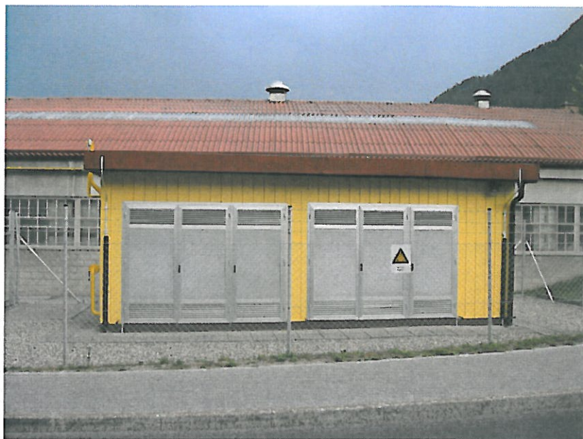
SLIKA 2: MRP Pivovarna