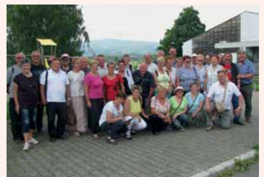
Udeleženci srečanja krvodajalcev v Veržeju.

Letos mineva 30 let, ko so se pri Krajevni organizaciji Rdečega križa Veržej v sodelovanju z Območnim združenjem Rdečega križa Ljutomer odločili za organizacijo in izvedbo vseslovenskega srečanja krvodajalcev. Povezali so ga z obeleževanjem slovenskega dneva krvodajalcev, ki je 4. junija, in svetovnim dnevom krvodajalcev, 14. junija. Ker je letošnje srečanje jubilejno, smo se pri Območnem odboru Rdečega križa Laško – Radeče odločili, da se srečanja udeležimo tudi s krvodajalci iz laške in radeške občine. Vseh krvodajalcev nismo mogli vabiti, ker bi jih bilo preveč, zato smo tokrat povabili le vse častne krvodajalce. To so tisti, ki so kri darovali 50- in večkrat, in krvodajalke, ki so kri darovale 30-krat in več. Od vseh 179 pova-