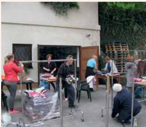
Prostovoljci nam pomagajo pri različnih aktivnostih.

Območni odbor je na eni svojih zadnjih sej minulega mandata oblikoval in potrdil seznam programov Rdečega križa, v katere se lahko vključujejo prostovoljci RK, sprejel pa je tudi predlog programa seminarja zanje. Za ta korak smo se odločili, ker doslej še nismo imeli tako celovito izdelanega popisa vseh možnih oblik in vsebin delovanja tistih prostovoljcev, ki so pripravljene svoj čas in nekaj dobrega postoriti za organizacijo Rdečega križa, predvsem pa za njene programe v dobrobit naših občanov. Možnosti in priložnosti je veliko tako v okviru Območnega združenja RK kot v krajevnih organizacijah Rdečega križa laške in radeške občine, ki že sedaj povezujejo več kot 200 prostovoljcev. Zmotno je prepričanje, da je zgolj pobiranje članarine na terenu delo naših prostovoljcev, čeprav je za obstoj organizacije ena od pomembnih nalog. Priložnosti je dovolj tudi na drugih področjih, zato ste vladno vabljeni vsi, ki bi želeli v Rdečem križu delati prostovoljno, da se nam pridružite.