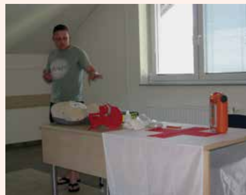
Vročje junijsko popoldne je malce okrnilo število prisotnih na usposabljanju v Rimskih Toplicah.

V minulem obdobju smo opravili predstavitve defibrilatorjev v Jurkloštru, Mariji Gradcu, Šentrupertu, Sedražu in Rečici. V juniju smo v dogovoru s KS Vrh nad Laškim in Rimske Toplice ter tamkajšnjima krajevnima organizacijama Rdečega križa s pomočjo naših predavateljev pripravili predstavitvi za krajanje. Obe predstavitvi sta bili umeščeni v sklop dogodkov ob praznovanju krajevnih praznikov. Hkrati s predstavitvijo smo omogočili vsem krajanom in članom RK, da se s posebno prijavnico prijavi na brezplačno usposabljanje iz temeljnih postopkov oživljanja z uporabo defibrilatorja, ki bodo za vse prijavitelje izvedena v mesecu septembru. V septembru in oktobru bomo izvedli še predstavitvi v Laškem in Zidanem Mostu. S tem dejanjem bomo sklenili krog brezplačnih usposabljanj za naše krajanje, za katere so stroške krile krajevne organizacije Rdečega križa iz članarine.