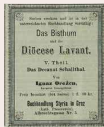
Časopisni oglas za V. del Zgodovine lavantinske škofije (ANNO).