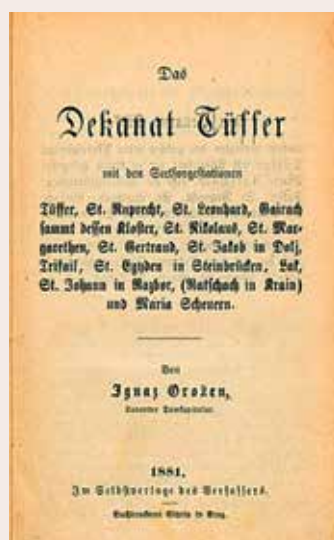
Zgodovina lavantinske škofije, IV. zvezek, Dekanija Laško, 1881.