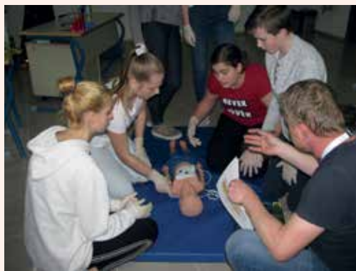
Že v pripravi in pri samem tekmovanju osnovnošolskih ekip prve pomoči se mladi naučijo veliko veččin nudenja prve pomoči.

Vse, ki vas tovrstno delo zanima in bi bili pripravljene sodelovati z nami, prosimo, da nas pokličete na naš sedež ali nam to sporočite na elektronski naslov: rdeci.kriz.lasko@siol.net. Za vaš odziv vam bomo zelo hvaležni.