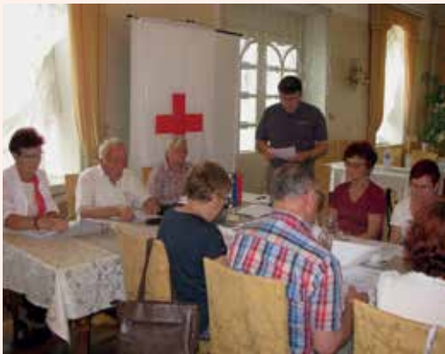
Na volilnem zboru članov Rdečega križa laške in radeške občine v Thermani Laško.

Letošnje leto je za Območno združenje Rdečega križa Laško – Radeče, v katerega je preko krajevnih organizacij vključenih 4.490 članov, tudi volilno leto, saj se je članicam in članom vodstva in organov ter sekretarju iztekel štiriletni mandat. Zato so sredi junija na rednem letnem in hkrati volilnem zboru članov med drugim volili novo vodstvo in organe združenja ter opravili imenovanje sekretarja za naslednje štiriletno mandatno obdobje.