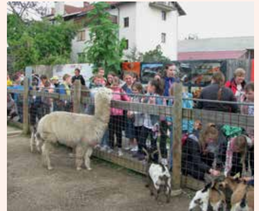
Na ekskurziji krožkov Rdečega križa smo se kar dolgo zadrževali v Farmyardu, kjer nas je navduševala alpaka, udomaćena vrsta južnoameriške kamele v družbi kozic.