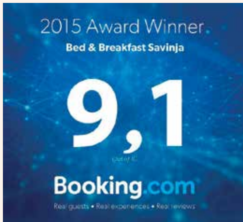
Booking nagrada gostov.

Prenočišča Savinja, ki so od julija 2014 ponovno odprta za goste, so ob zaključku preteklega leta prejela Booking nagrado za visoko oceno gostov. Pridobljena ocena dokazuje, da Prenočišča Savinja še vedno sodijo med visoko kakovostne nastanitve, kjer je poskrbljeno za dobro počutje gostov.