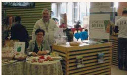
Okraševanje lectovih src Čebelartsva in lectarstva Šolar na sejmu NATOUR Alpe-Adria.

V mesecu januarju so bili izpolnjeni vsi pogoji za pridobitev znaka SLOVENIA GREEN, ki se podeljuje zelenim destinacijam, ki skrbijo za trajnostni razvoj na ekonomskem, družbenem in okoljskem področju. Laško se je v okviru Slovenske turistične organizacije na sejmu NATOUR Alpe-Adria že predstavljajo kot zelena destinacija.