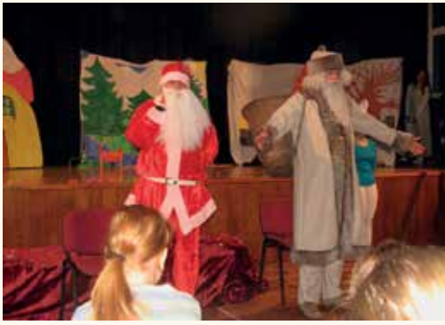
Laško, KS Zidani Most, Komunalni Laško, Sadjarstvu Aškerc – Globoko, Aban-