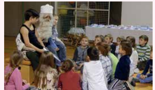
Učence je zelo razveselil prijazen dedek Mraz.

sede. V mesecu novembru in decembru smo imeli s starši tudi delavnici, kjer smo skupaj izdelovali novoletne voščilnice, ki so si jih lahko izbrali po prireditvi. Hvala staršem za vse dobrote in prostovoljne prispevke. Bilo nam je zelo lepo, zato bomo tradicijo nadaljevali. Čeprav smo že dobro zakorakali v novo leto, za izražanja lepih želja nikoli ni prepozno. Naj vas spremljata zdravje in mir, da bi skupaj preživeli čim več prijetnih trenutkov.