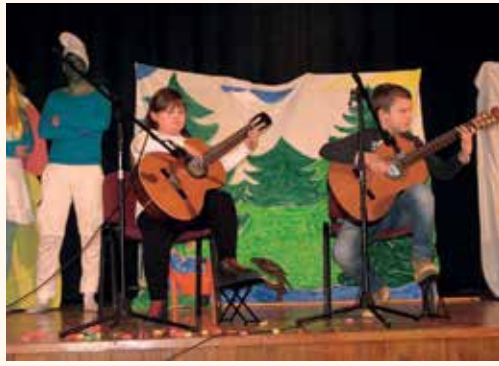
ki Ljubljana, d. o. o., ter podjetjem Apnec Zidani Most, Baron Company, d. o.