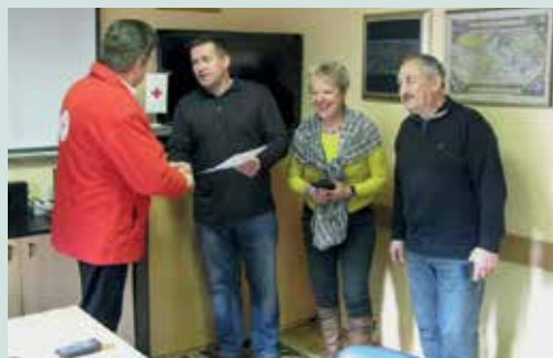
Predaja finančnih sredstev OO RK Laško.

vo skupino (otroci, mladostniki, odvisniki, socialno šibke družine, invalidi, osebe prizadete zaradi nasilja v družini), v drugem delu pa si želimo skupaj z različnimi akterji soustvariti prijazno okolje za starejšo populacijo, saj se moramo zavedati, da je staranje prebivalstva proces, ki se mu v razvitih državah, tudi v Sloveniji, ni mogoče izogniti. Z upadanjem števila rojstev, z daljšanjem življenjske dobe in z upočasnjevanjem umrljivosti se spremi-