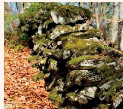
Neznano gradišče – več 100 metrov dolg zid