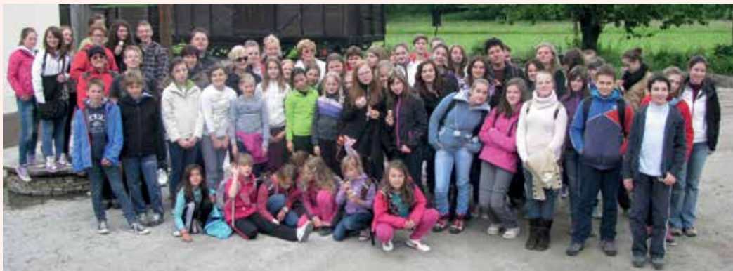
15. ekskurzija krožkov RK