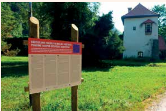
Prva od petih pojasnjevalnih tematskih tabel ob poti

Pot nadaljujemo po cesti v smeri naselja Mrzlo Polje. Ko se začne cesta vzpenjati, vidimo na naši desni Gračniški slap in obnovljen Šmidov mlin. Ustavimo se pri informacijski pojasnjevalni tabli z opisom mlina in Gračniškega slapa ter pojasnjevalni tematski tabli št. 2 Gračnica kot sveta reka Eridan.