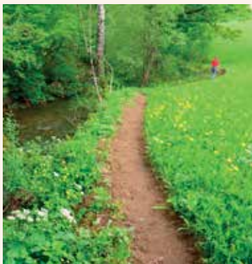
Urejen del poti ob Gračnici