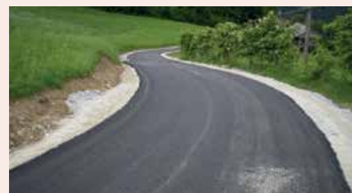
Obnova javne poti Privšek.

Na letošnji prireditvi Pivo Cvetje je naša KS sodelovala na prireditvi Lepo je na deželi. Prikazan je bil res lep in prisrčen program, ki so ga ustvarila naša društva in