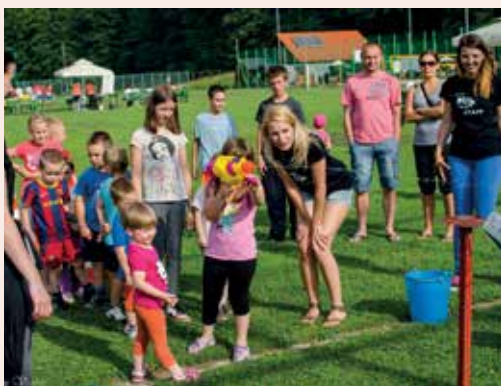
Najmlajši na Eksploziji športa.