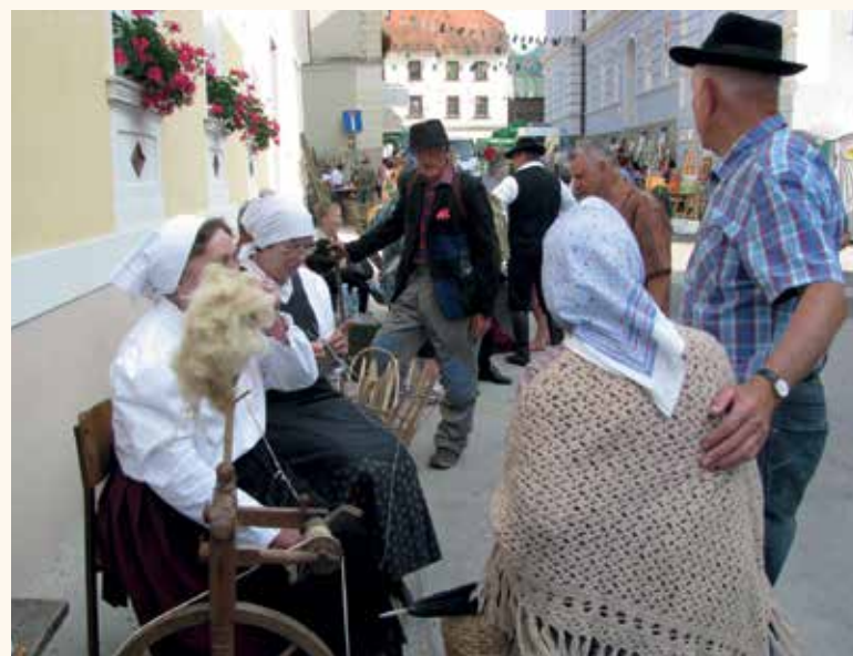
Poulično dogajanje je popestrilo utrip mesta

Potrebno je pohvaliti vse sodelujoče, ki so se v razmeroma kratkem času dobro pripravili na nastope oz. predstavitev. Zanimanje obiskovalcev in njihovo vključevanje je bilo precejšnje, kar nas je še posebej razveselilo.