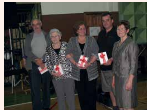
Podeljena darila zaslužnim krvodajalcem na prireditvi »Veselimose življenja« ali

Vsak prvi torek v mesecu, od 16. do 17. ure, smo na voljo v društvenem prostoru večnamenskega objekta Rimske Toplice. Pomagali vam bomo z različnimi informacijami in nasveti. Dvignete in oddate lahko tudi vloge za ugotavljanje upravičenosti do prejemanja materialne pomoči RK, zlasti prehrane. Vlogi je potrebno priložiti dokazila o premoženjskem stanju in prejemkih vseh družinskih članov.