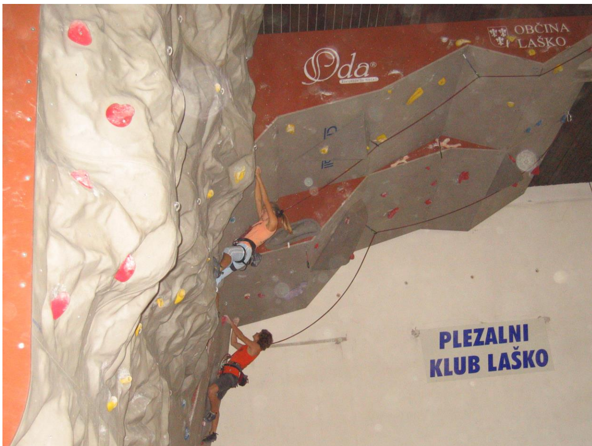
***** Slika: PlezalnaStena.jpg ***** ***** Tekst: Plezalna stena – pomembna pridobitev za Laško *****