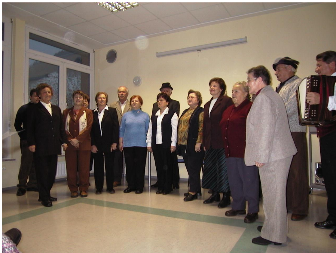
***** Slika: Otvoritev1.jpg in Otvoritev2.jpg ***** ***** Tekst: Utrinki iz otvoritve Centra starejših 30.11.2005. *****