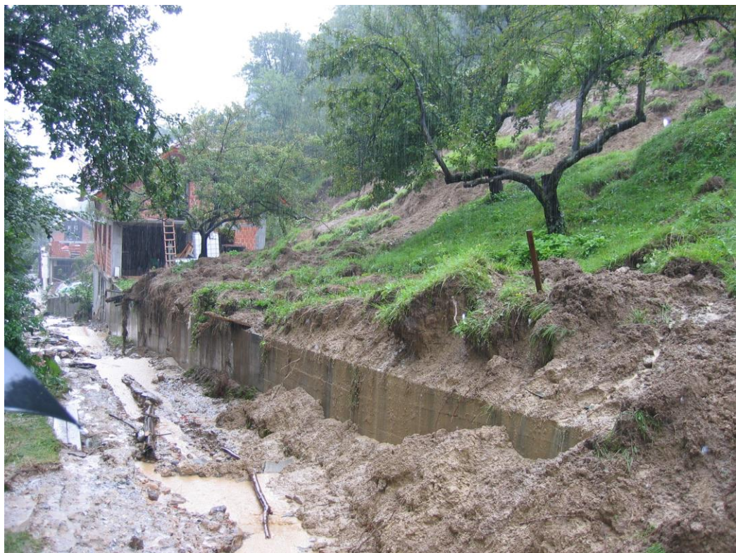
***** Slika: Neurje1.jpg in Neurje2.jpg *****