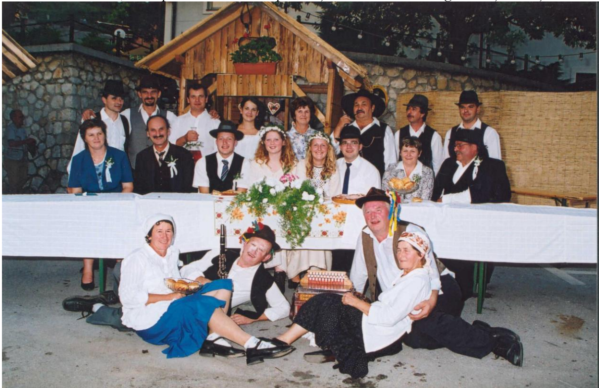
***** Slika: MalaBreza.jpg ***** ***** Tekst: Predstavitve kulturne sekcije Strelskega društva Mala Breza na prireditvi "Pivo Cvetje" 2005 s prikazom ohceti izpred 50 let

Vse to delamo zato, da s športom in kulturo povezujemo stare in mlade generacije v kraju.