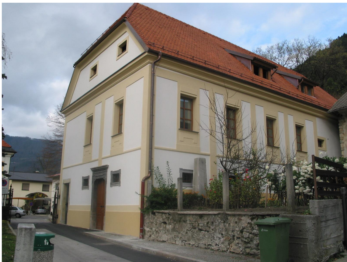
***** Slika: Knjiznica.jpg in Kislinger.jpg ***** ***** Tekst: Laški dvorec (Knjižnica Laško) in Kislingerjeva hiša (Muzejska zbirka).