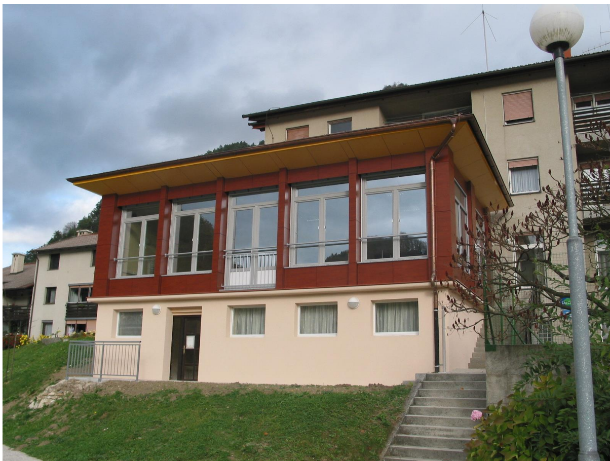
***** Slika: CenterStarejsih.jpg *****