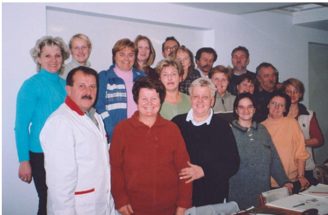
***** Slika: smocl.jpg ***** ***** Tekst: Zadovoljni udeleženci likovne sekcije. *****