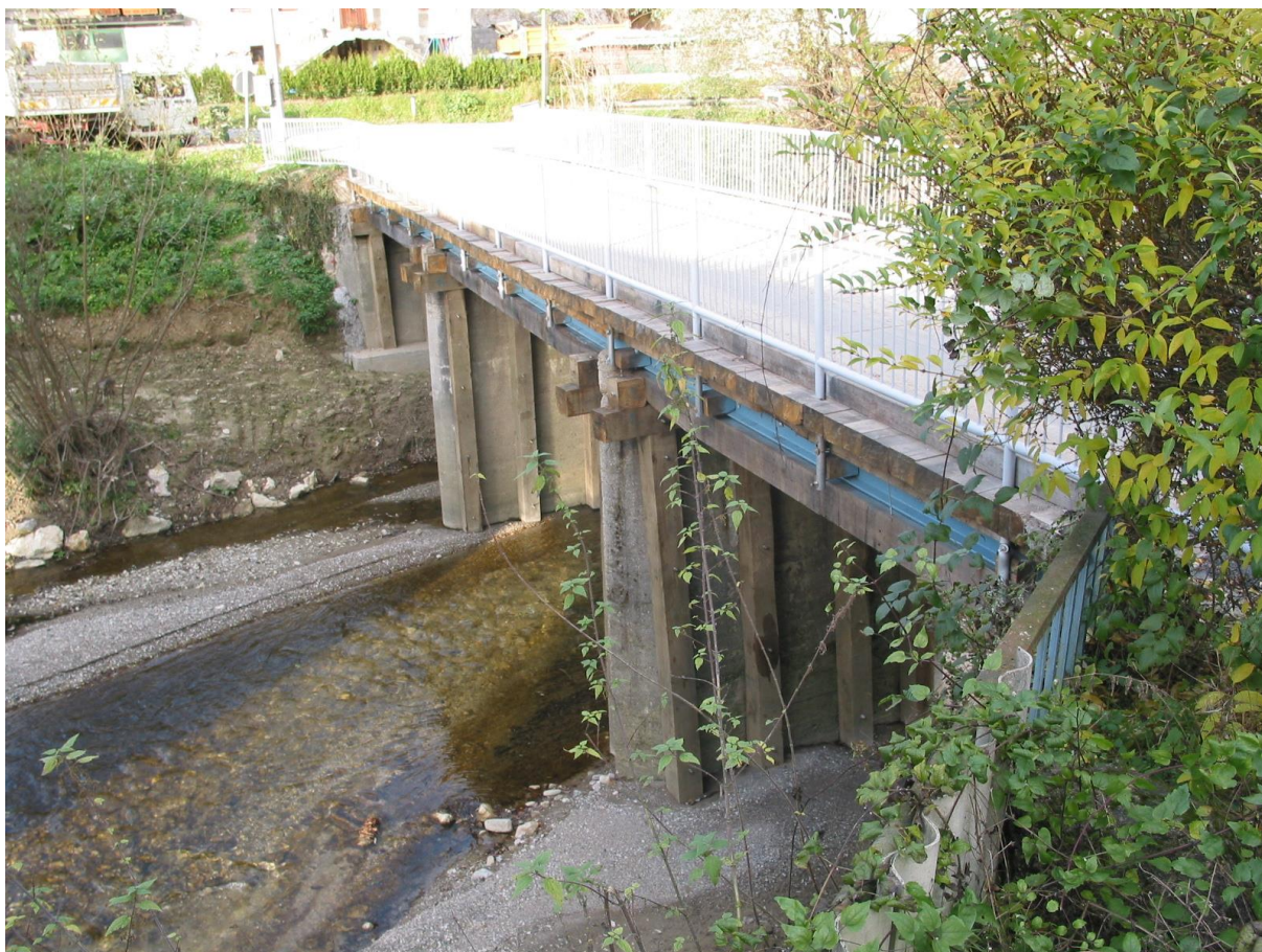
***** Slika: Most.jpg *****