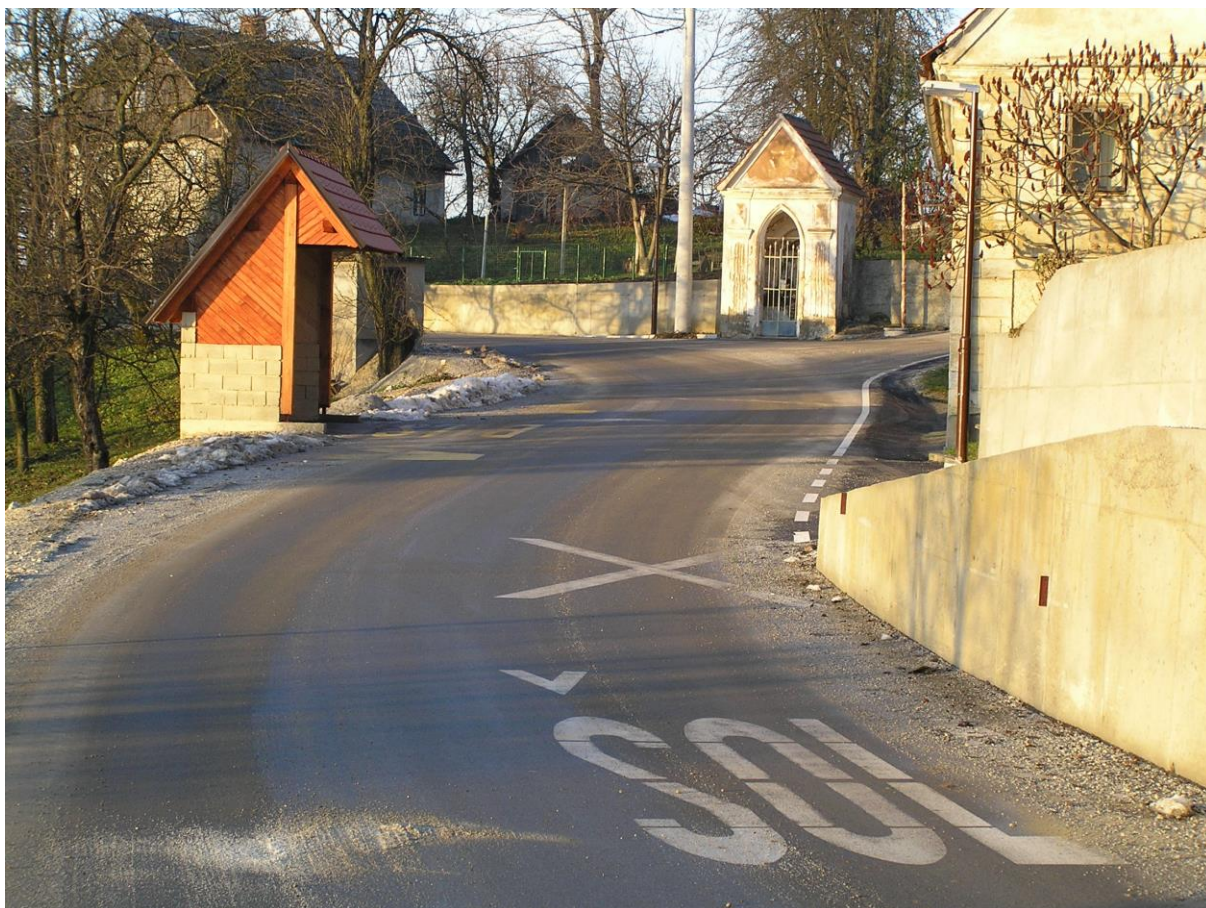
***** Slika: PotNaKobivjek.jpg in Vrh.jpg ***** ***** Tekst: Urejena cestišča Pot na Kobivjek in Vrh nad Laškim. *****